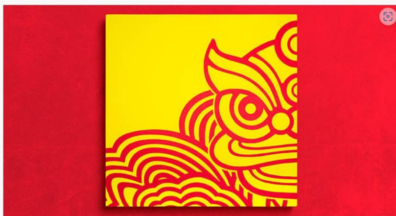
Nicolas Constantin, alias Nicko, Guangzhou Patterns no 9, 2026.