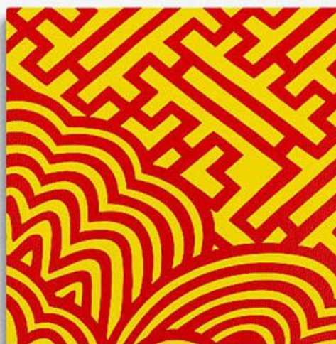
Nicolas Constantin, alias Nicko, Guangzhou Patterns nos 3 et 2, 2026. Photo © Nicko